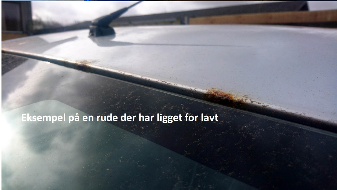
Eksempel på en rude der har ligget for lavt