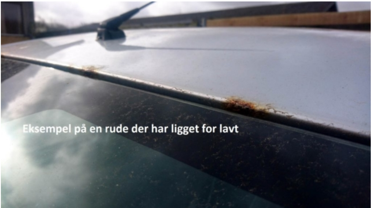
Eksempel på en rude der har ligget for lavt